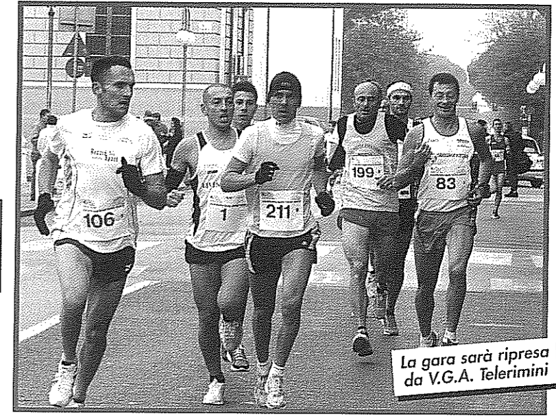
La gara sarà ripresa da V.G.A. Telerimini

Iscrizioni anticipate entro il 14 Novembre a mvm@tuttopodismo.it Regolamento calendario MVM, info, classifiche e foto su www.tuttopodismo.it