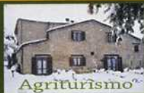
Agriturismo "Il Poggiolo"